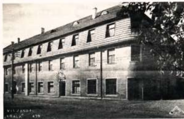
Ugala teater tegutses Seasaare kõrtsi teisel korrusel asuvas saalis aastatel 1924–1941.