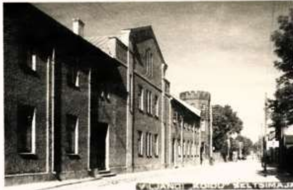
Ugala mängis Koidu seltsimaja teatrisaalis kahel perioodil: asutamisest kuni 1924. aastani ja aastatel 1941–1981.